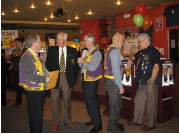
Début de l'activité « Défi de l'entreprise »