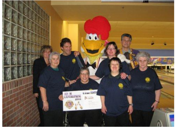
Équipe du PHARS de 9 heures a.m.