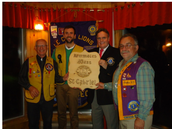
Cette plaque est une création de notre collègue, le Lion Carl Rioux.