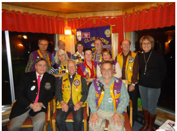
Voici les nombreux Lions qui se sont mérités l'épinglette du « 100 % présences » en 2014-2015. Quelle belle équipe active !