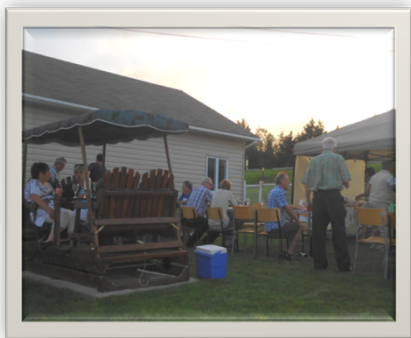
Vue d'ensemble des nombreux participants (Lions et conjoints(es)).

Oui, on s'est bien amusé et mis les bases à tous nos projets.